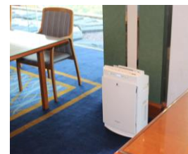
新たに空気清浄機を10台 設置しております