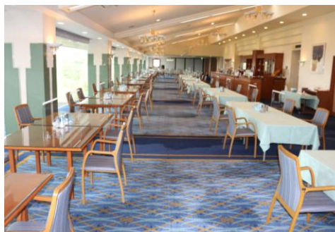
＜レストラン＞ テーブルの幅を 普段の2倍に 広げております