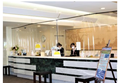
各受付にビニールカーテンを設置しております