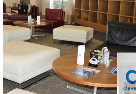
クレベリン、加湿空気清浄機 で空間の除菌及び換気を 徹底しております