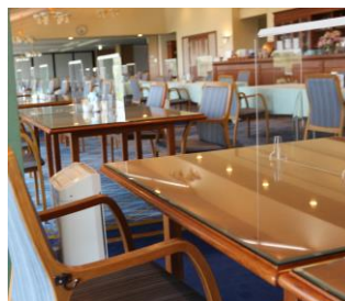
テーブル中央にアクリルパテーション を設置しております